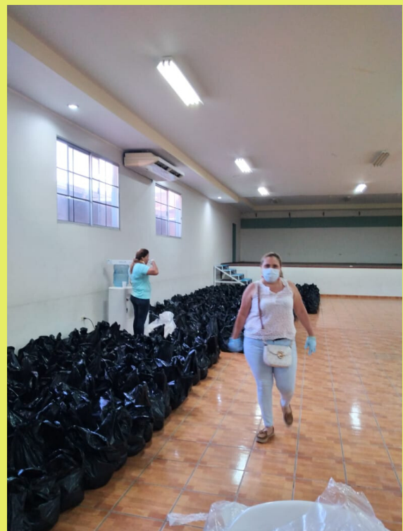
01 Acompañamiento en la organización de ayuda Humanitaria