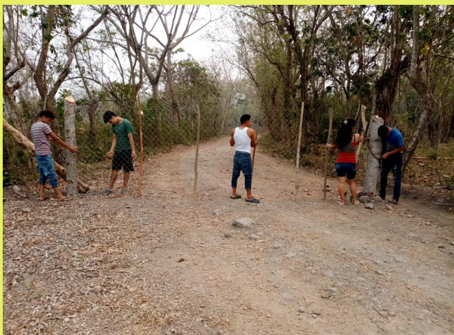
02 Cierre de Calles hacia la comunidad de Nuevo Mundo.