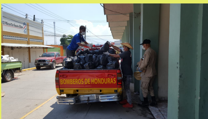
03 Entrega de Ayuda Humanitaria a los barrios y colonias con el apoyo de CCT y Bomberos.

Quédate pendiente de mas hallazgos y Recomendaciones para potrerillos Cortes! Este es un trabajo impulsado por la CCT y Red local de Defensores DDHH con el acompañamiento de OCDIH